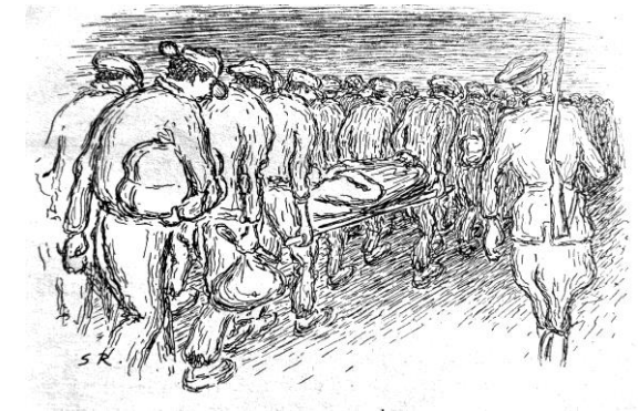
De første skritt mot gasskamrene

Berg interneringsleir er uten sidetykke i Norges okkupasjonshistorie, da den var den eneste fangeleiren under norsk administrasjon, underlagt det nazifiserte norske politidepartement.