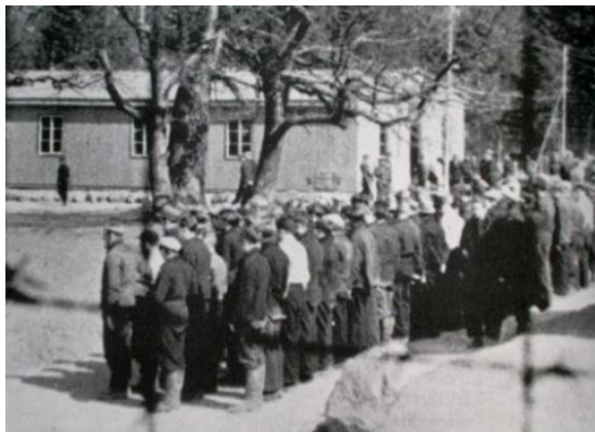
Illegalt foto fra Berg under krigen

772 jøder ble sendt ut av Norge som fanger under den annen verdenskrig. De kom fra hele Norge, og ca 230 av dem ble sendt via Berg. Kun 34 av de 772 kom tilbake i live.